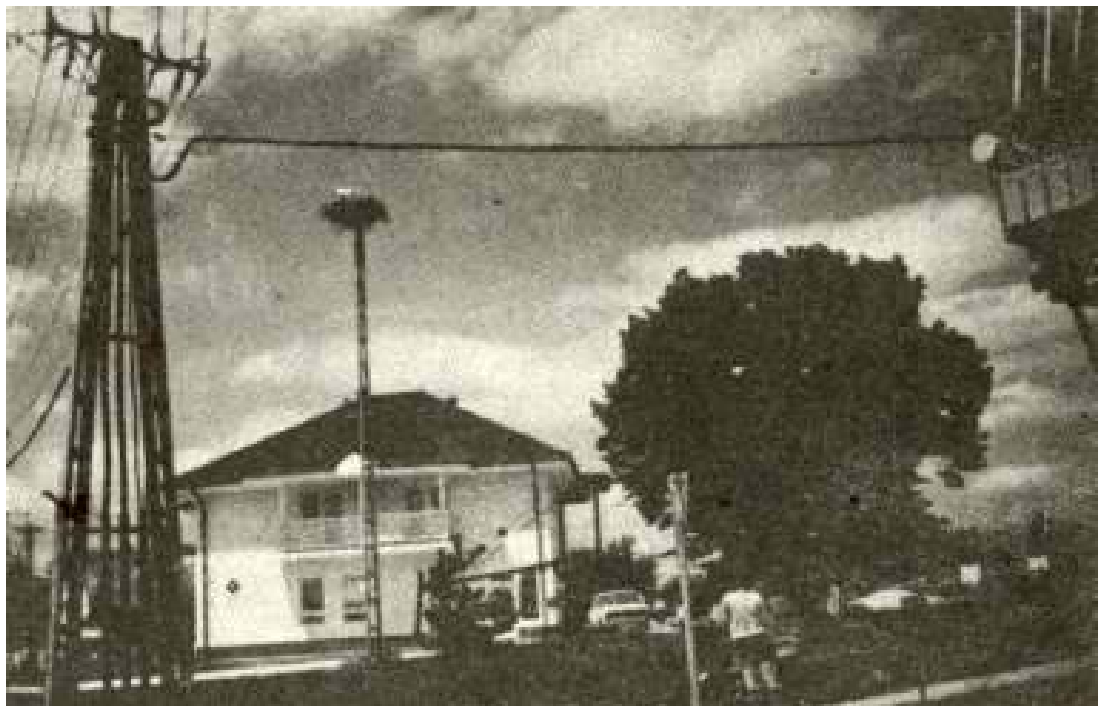
A Bükön építkezés miatt új helyre felállított oszlopon eredményesen költöttek a gólyák