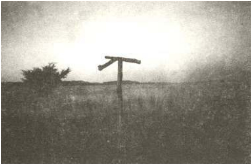
A ragadozómadarak zsákmányszerzését segítik a tömördi rétekre kihelyezett "T" fák